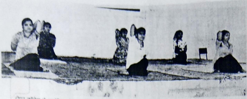
डीएन कॉलेज में आयोजित योग कार्यक्रम में योग करती छात्राएं।