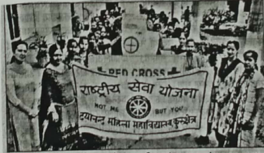
जागरूकता रैली निकालती अध्यापिकाएं व छात्राएं। (बरोकर)