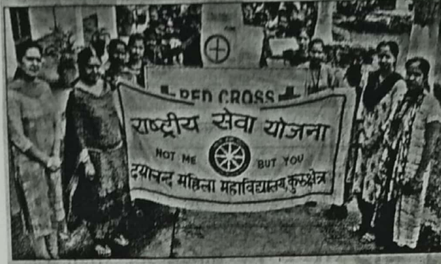
एनएसएस और रेडक्रॉस के सदस्य जागरूकता रैली निकालते हुए।