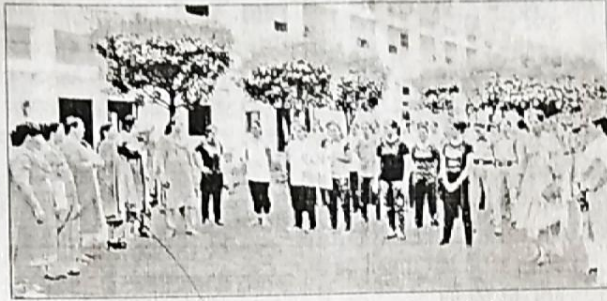
कार्यक्रम में भाग लेने वाली छात्राएं अध्यापिकाओं के साथ।