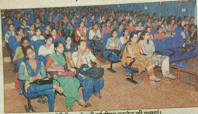
डाक्यूमेंट्री फिल्म देखती हुई डीएन कालेज की छात्राएं।