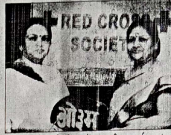
डाक्टर को स्मृति चिह्न भेंट करती प्राचार्या।