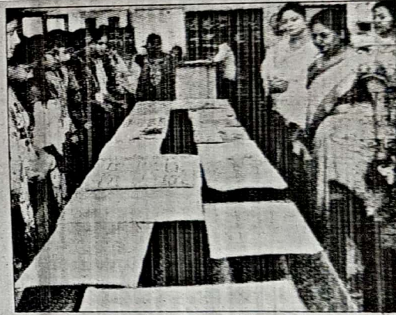
पोस्टर मेकिंग प्रतियोगिता में हिस्सा लेती छात्राएं।