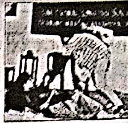
लघुनाटिका प्रस्तुत करती छात्राएं।

प्राचार्य ने सभी प्रतिभागियों की सराहना की।