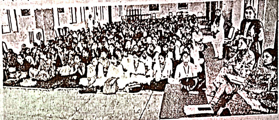
कुरुक्षेत्र। डीएन कॉलेज में आयोजित ओरिएंटेशन कार्यक्रम में हिस्सा लेती छात्राएं।