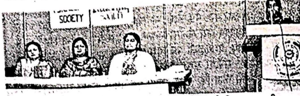
डीएन कॉलेज में आयोजित भाषण प्रतियोगिता में अपने विचार रखती छात्रा।