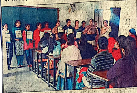
कार्यक्रम में भाग लेती छात्राएं।