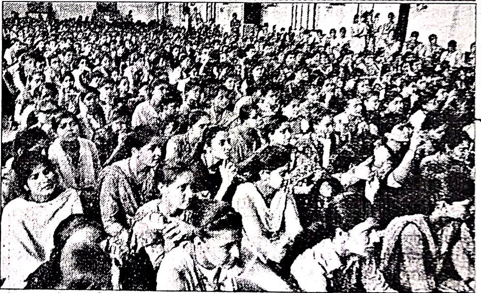
कुरुक्षेत्र के डीएन महिला कॉलेज में स्टेज पर चल रही प्रस्तुति देखती छात्राएं।

दयानंद (डीएन) महिला कॉलेज के महिला प्रकोष्ठ एवं आर्य युवती परिषद् के तत्वाधान में न्यू उत्थान थियेटर समूह के सहयोग से खबरदार नाटक का मंचन किया गया। हरियाणा कला परिषद पंचकूला की ओर से प्रायोजित यह नाटक नारी जीवन को केंद्रित करके रचा गया। अजन्मी कन्या वापस यमराज के दरबार में पहुंच जाती है और अपनी व्यथा सुनाती है। चित्रगुप्त और यमराज के सामने वह भ्रूण हत्या, दुष्कर्म, दहेज हत्या, घरेलू हिंसा, संपन्न परिवारों में भी नारी शोषण के चित्र रखती है और धरती पर वापस जाने से मना करती है। असल में नाटक जहां समाज के नकारात्मक पहलुओं को छात्राओं के सामने लाकर उन्हें झकझोरता है, वहीं सकारात्मक उदाहरण पेश कर समाज में सुधार संभव होने वाले उन्हें प्रेरित भी करता है।