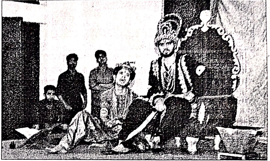
कुरुक्षेत्र के डीएन महिला कॉलेज में नाटक का मंचन करते कलाकार।