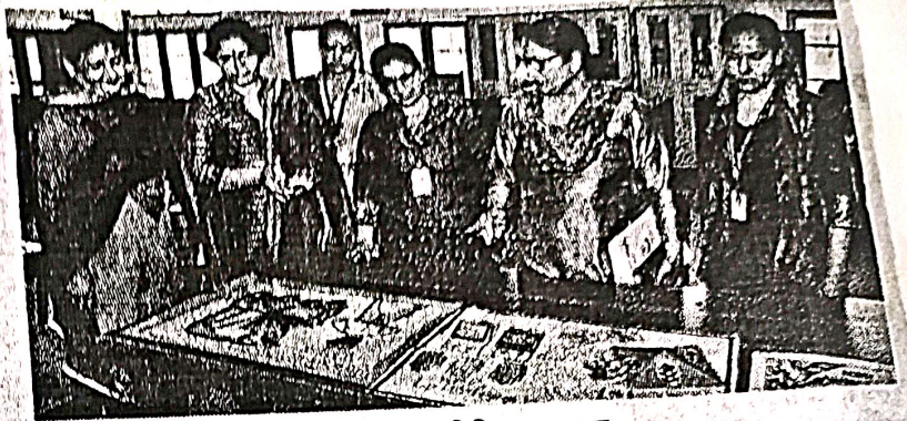
चित्रकला प्रदर्शनी का अवलोकन करती मुख्यतिथि