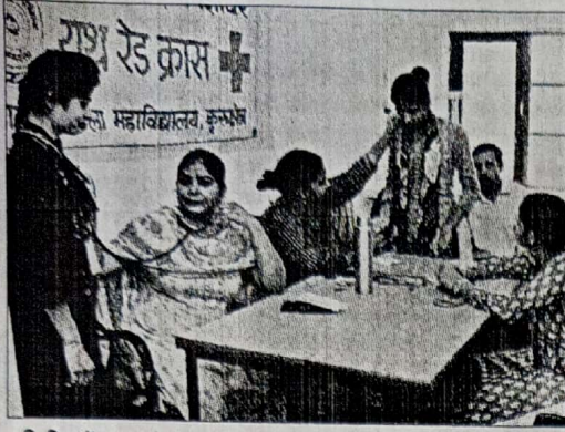
शिविर में छात्राओं के स्वास्थ्य की जांच करती महिला चिकित्सक।