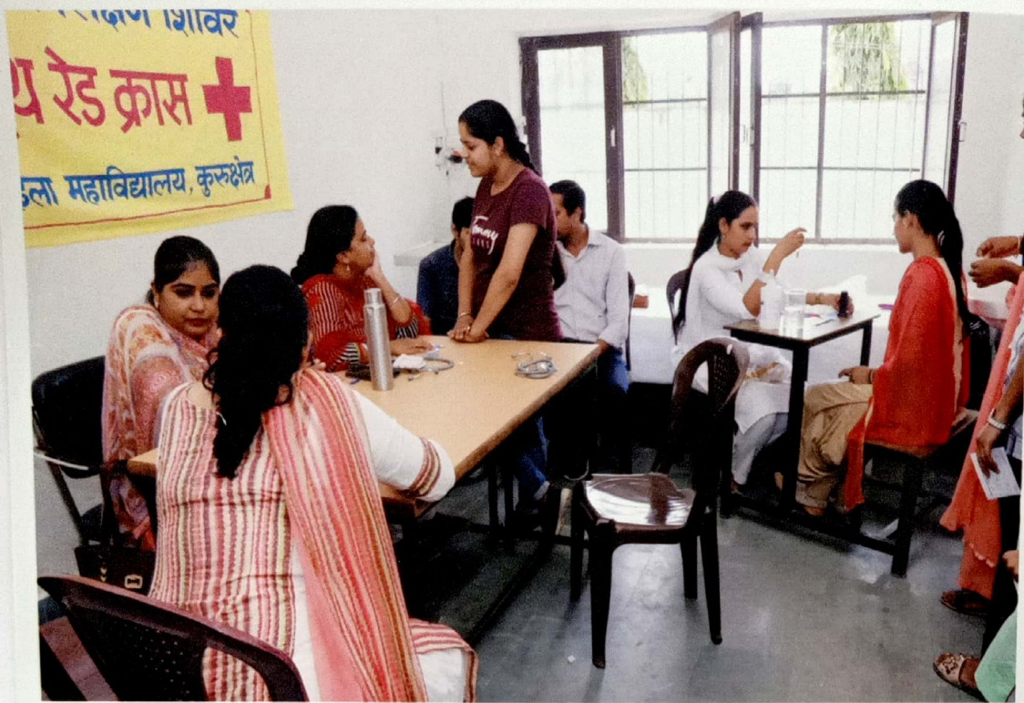
2019-20 Health Check-up Camp 21.9.2019