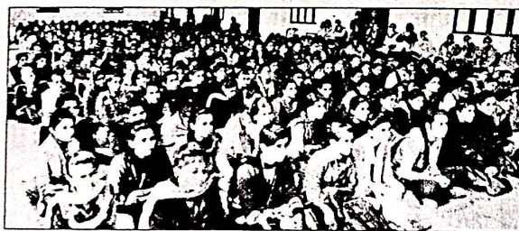
दयानंद महिला महाविद्यालय में सैमीनार में भाग लेती छात्राएं।