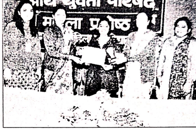
भाषण प्रतियोगिता की विजेता छात्रा को पुरस्कार प्रदान करते मुख्यातिथि।