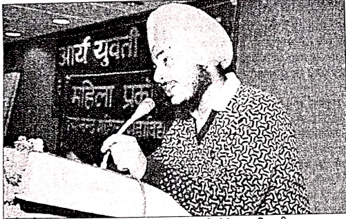
डीएन महिला कॉलेज में मंच पर प्रस्तुति देते हुए प्रतिभागी।