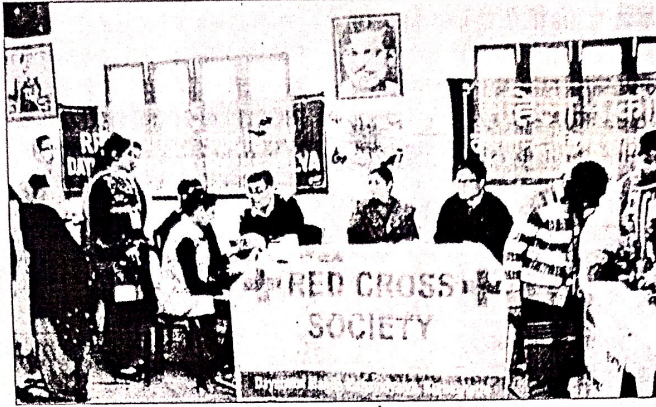
छात्राओं की स्वास्थ्य की जांच करते डाक्टर।