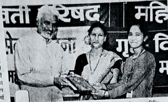
दयानन्द महिला महाविद्यालय में पुरस्कार वितरित करते मुख्य अतिथि।