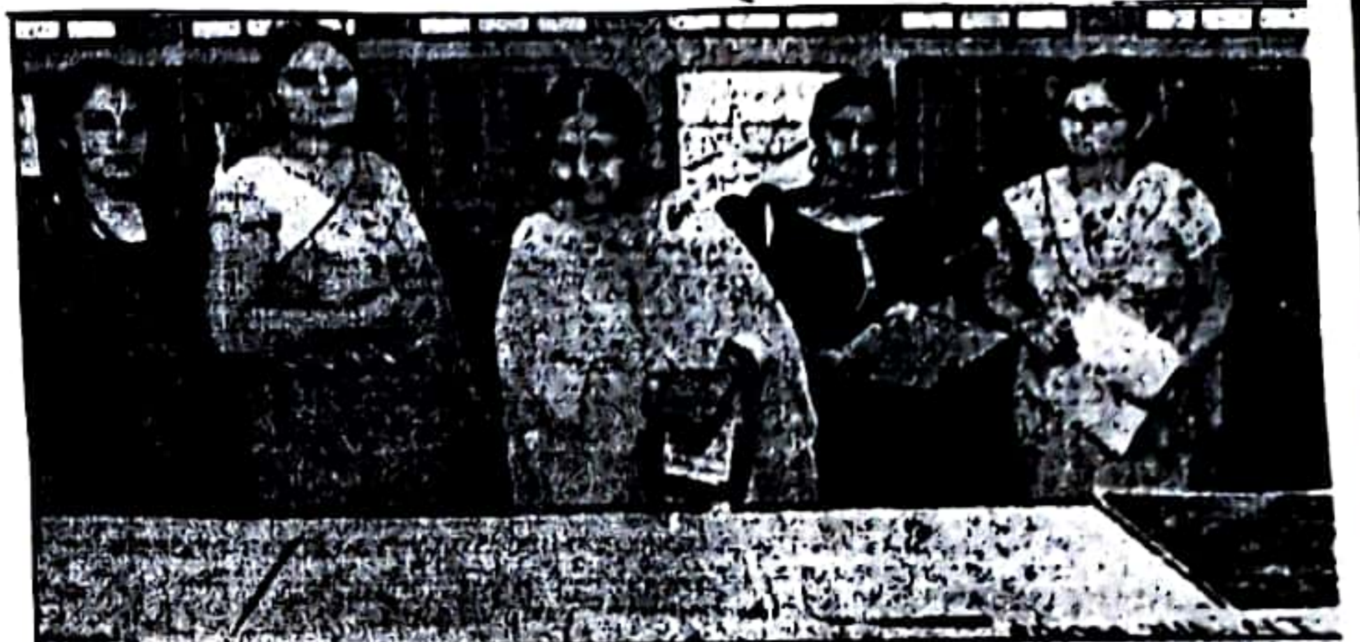
छात्राओं द्वारा बनाए-पोस्टरों का अवलोकन करती प्राचार्या व अध्यापिकाएं। (कुरुक्षेत्र) गांधी जी के प्रेरक तथ्य विषय पर प्रतियोगिता का आयोजन