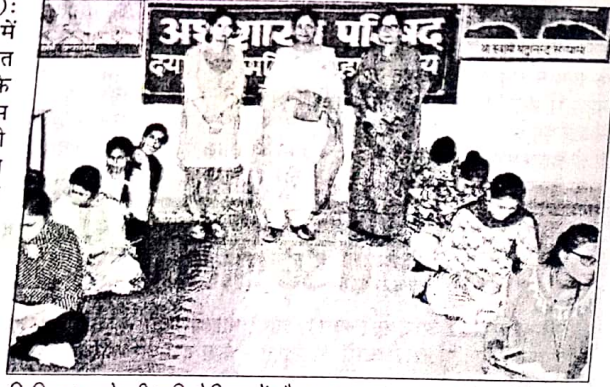
लिखित प्रश्नोत्तरी प्रतियोगिता में मौजूद छात्राएं व अध्यापिकाएं।