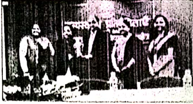
विजेता टीम को पुरस्कृत करते मुख्यातिथि व अन्य।