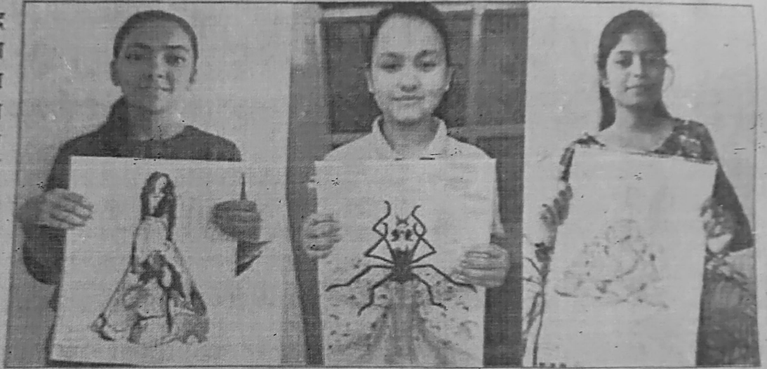
अंतःकक्षीय ऑनलाइन 'पोशाक स्केचिंग' प्रतियोगिता का विजेता छात्राएं।