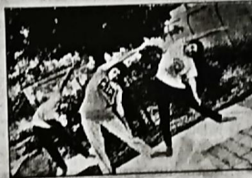
योगासन करती महाविद्यालय की छात्राएँ।