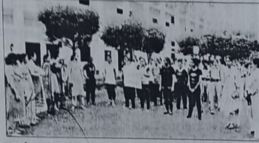
कार्यक्रम में भाग लेने वाली छात्राएं अध्यापिकाओं के साथ।