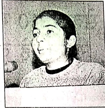
दयानंद महिला कालेज में प्रतियोगिता के दौरान भाषण देती छात्रा।