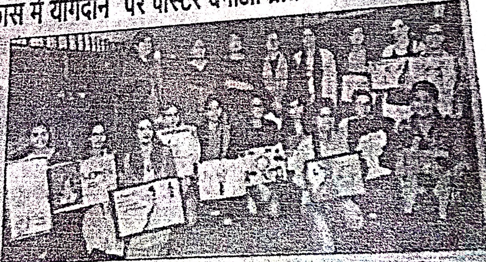
कार्यक्रम में भाग लेने वाली छात्राएं प्राचार्या के साथ। (नगर)