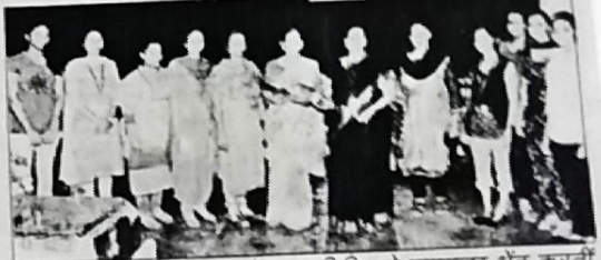
आर्य कन्या महाविद्यालय में मुख्यातिथि को पुष्पगुच्छ भेंट करती प्राचार्या।