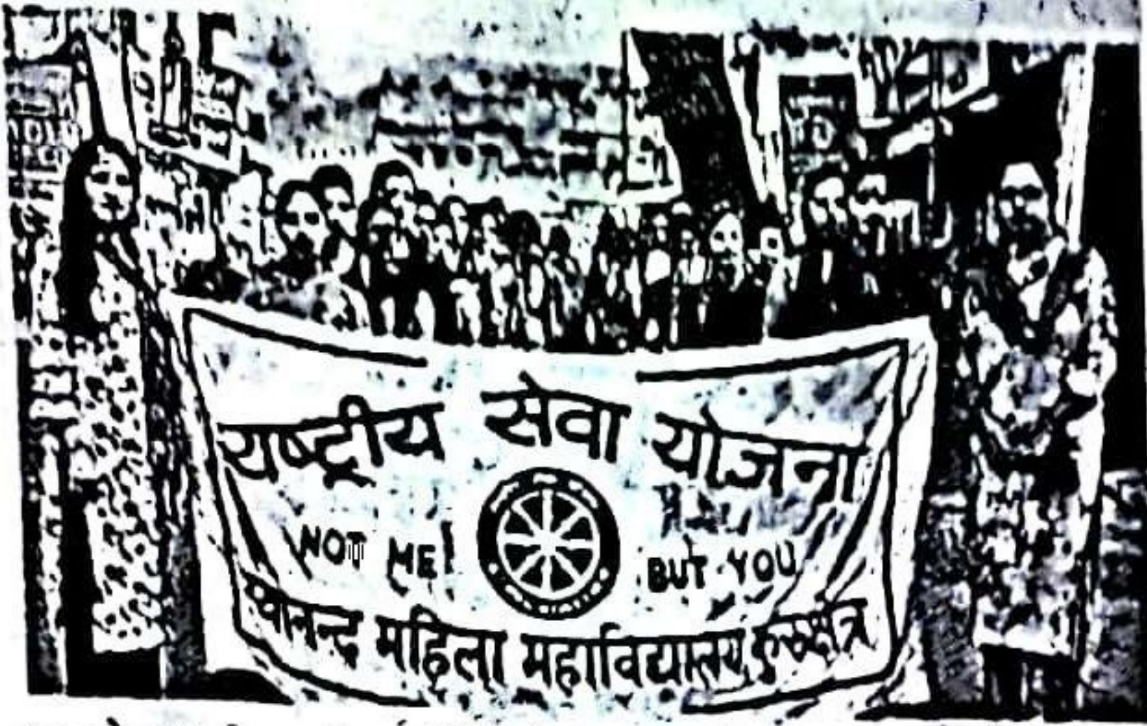
कुरुक्षेत्र | डीएन महिला कॉलेज में जागरूकता रैली निकालती छात्राएं।