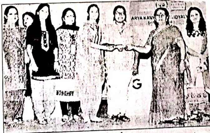
विजेता को पुरस्कार देते प्राचार्या।