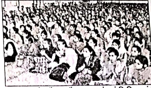
व्याख्यान के दौरान मौजूद छात्राएं एवं शिक्षिकाएं।