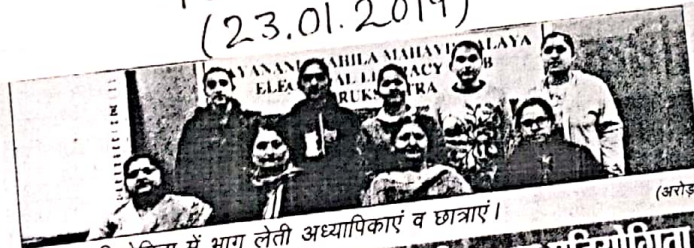
भाषण प्रतियोगिता में भाग लेती अध्यापिकाएं व छात्राएं।