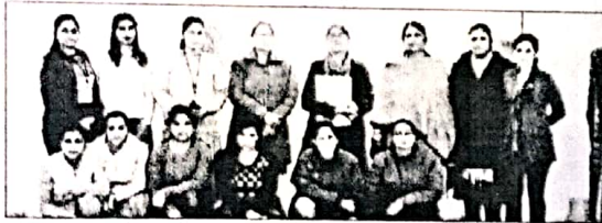
रंगोली प्रतियोगिता में भाग लेती छात्राएं।