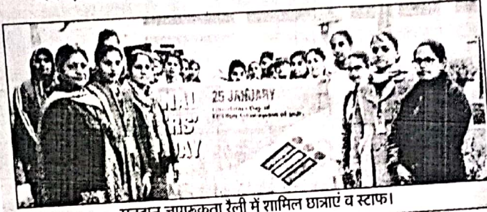
मतदान जागरूकता रैली में शामिल छात्राएं व स्टाफ।