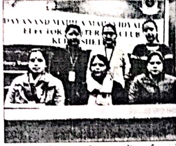
दयानंद महिला महाविद्यालय में कार्यक्रम में भाग लेती अध्यापिकाएं व छात्राएं।