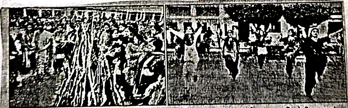
लोहड़ी अलाव में आहुति डालती मुख्यातिथि व महाविद्यालय की प्राचार्या एवं प्रस्तुति देती छात्राएं।