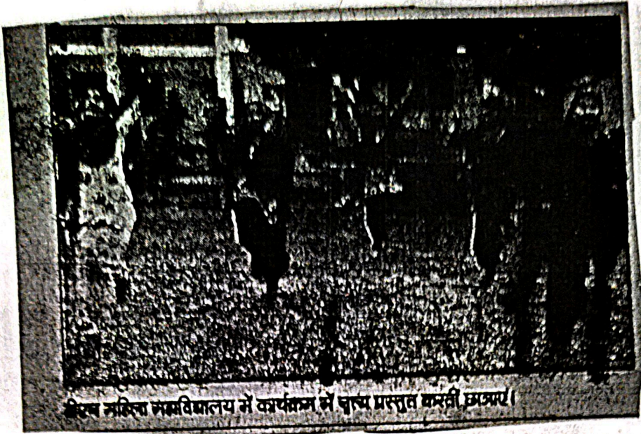
शिव मठिना महाविद्यालय में कार्यक्रम में वाच्य प्रस्तुत करती छात्राएं।