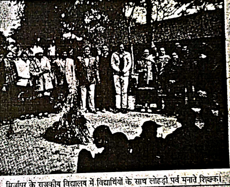
मिर्जापुर के राजकीय विद्यालय में विद्यार्थियों के साथ लोहड़ी पर्व मनाते शिक्षक।