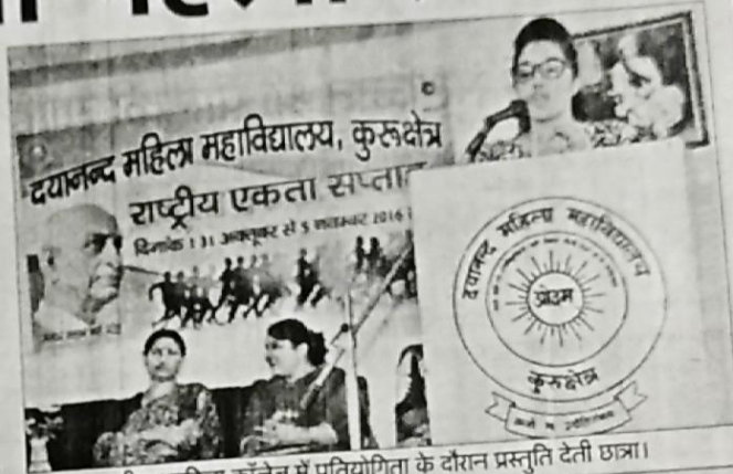
डीएन महिला कॉलेज में प्रतियोगिता के दौरान प्रस्तुति देती छात्रा।