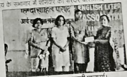
विजेता को पुरस्कृत करती प्राचार्या।