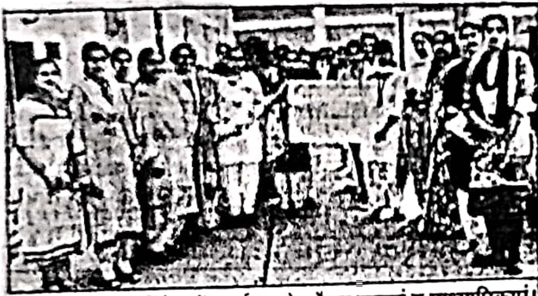
दयानंद महिला कॉलेज में कार्यक्रम के दौरान छात्राएं व प्राध्यापिकाएं।

पत्र वाचन से डाला सरदार पटेल के जीवन पर प्रकाश : दयानंद महिला कॉलेज की नएएसएस यूनिट ने से सरदार वल्लभभाई पटेल की जयंती को 'राष्ट्रीय एकता दिवस' के रूप में मनाया। 'पत्र-वाचन एवं रन फॉर यूनिटी' गतिविधि कराई गई।