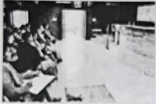
कार्यक्रम में भाग लेती छात्राधिकार संसद।