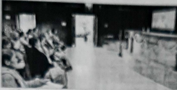
राष्ट्रीय युवा संसद समारोह 2019 का सीधा प्रसारण देखने कीवारे छात्रों में उत्साह।

दयानंद महिला महाविद्यालय में राष्ट्रीय युवा संसद समारोह 2019 का प्रसारण किया गया। इस दौरान नरेंद्र मोदी ने युवा संसद में विजेताओं को पुरस्कार प्रदान कर युवा वर्ग को प्रोत्साहित किया। इस अवसर पर प्रधानमंत्री मोदी का मुख्य कार्यक्रम दो पंचम रूपमें प्रसारण अंतर्गत की गई। इस अवसर पर प्रधानमंत्री नरेंद्र मोदी ने युवा संसद में विजेताओं को पुरस्कार प्रदान कर युवा वर्ग को प्रोत्साहित किया। इस अवसर पर प्रधानमंत्री नरेंद्र मोदी ने युवा संसद में विजेताओं को पुरस्कार प्रदान कर युवा वर्ग को प्रोत्साहित किया।