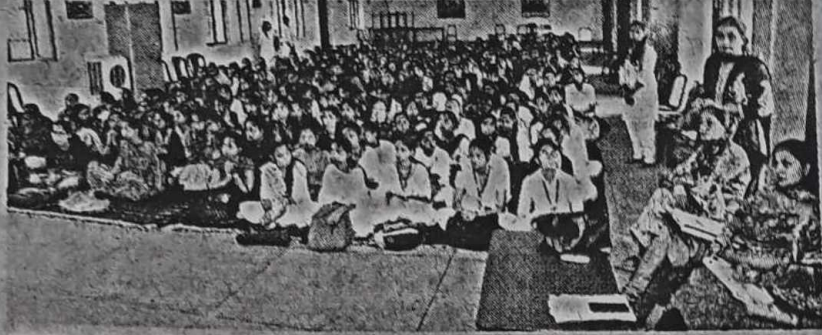
कुरुक्षेत्र। डीएन कॉलेज में आयोजित ओरिएंटेशन कार्यक्रम में हिस्सा लेती छात्राएं।