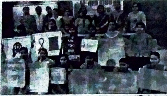
पोस्टर दिखाती छात्राएं व साथ में अतिथिगण

कुरुक्षेत्र, 7 अप्रैल (धमीजा) : दयानंद महिला महाविद्यालय कुरुक्षेत्र में रेड रिबन क्लब की ओर से विश्व स्वास्थ्य दिवस के उपलक्ष्य में पोस्टर मेकिंग व स्लोगन लेखन गतिविधियों का आयोजन करवाया गया। महाविद्यालय की 42 छात्राओं ने पोस्टर मेकिंग तथा 26 छात्राओं ने स्लोगन लेखन प्रतियोगिताओं में भाग लिया।