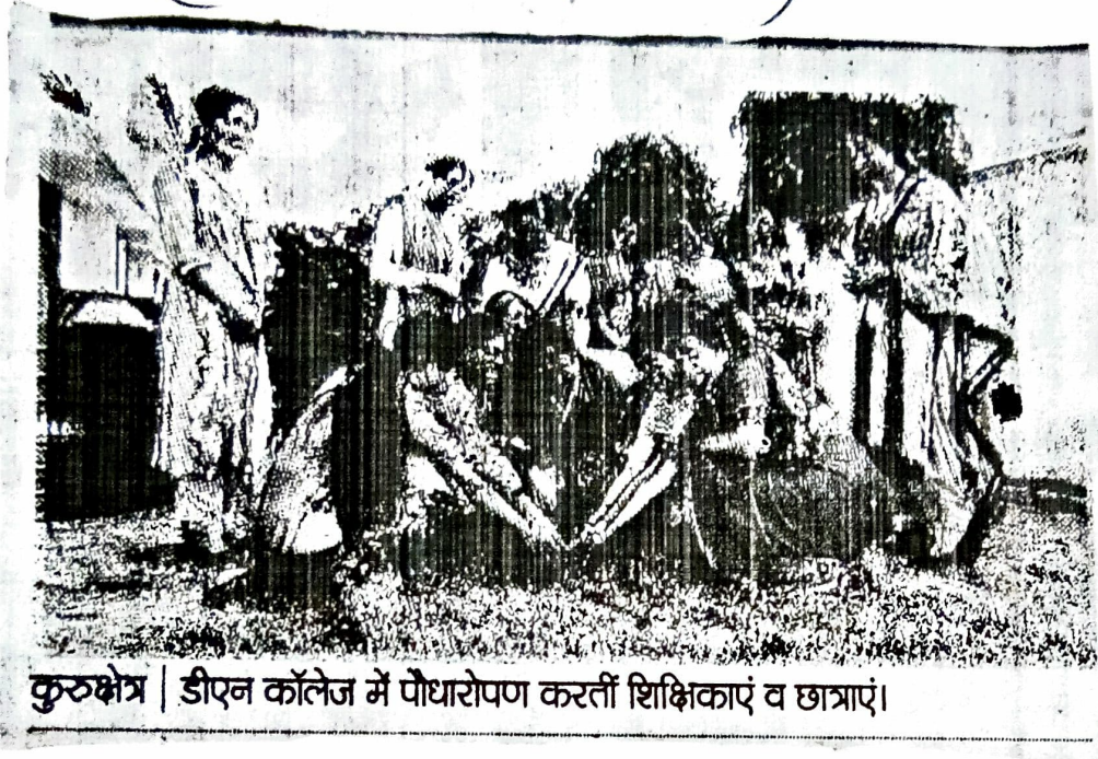
कुरुक्षेत्र | डीएन कॉलेज में पौधारोपण करती शिक्षिकाएं व छात्राएं।