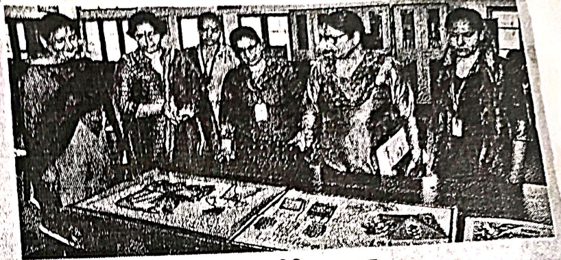
चित्रकला प्रदर्शनी का अवलोकन करती मुख्यतिथि