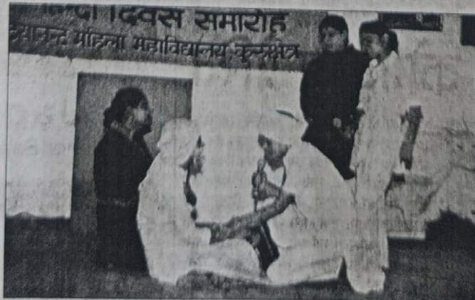
डी.एन. महिला कॉलेज में आयोजित हिन्दी दिवस समारोह में नाटक प्रस्तुत करती छात्राएं।