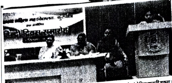
हिंदी दिवस पर दयानंद महिला महाविद्यालय में आयोजित कार्यक्रम को संबोधित करती वक्ता।