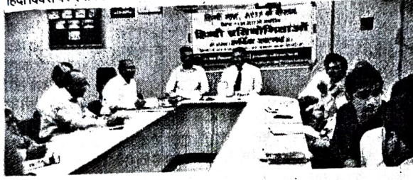
पीएनबी की बैठक में मौजूद अधिकारी।