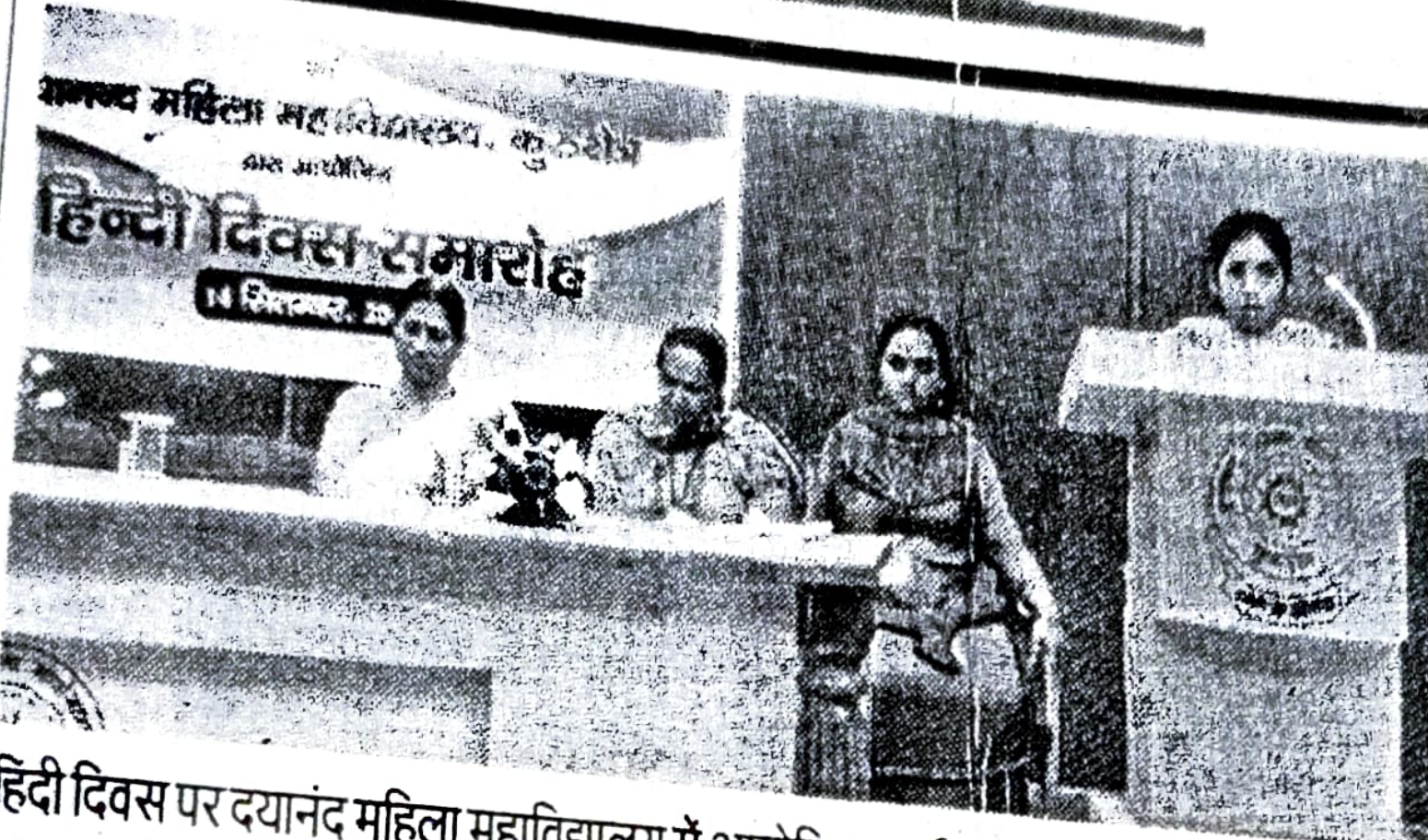
हिंदी दिवस पर दयानंद महिला महाविद्यालय में आयोजित कार्यक्रम को संबोधित करती वक्ता ।