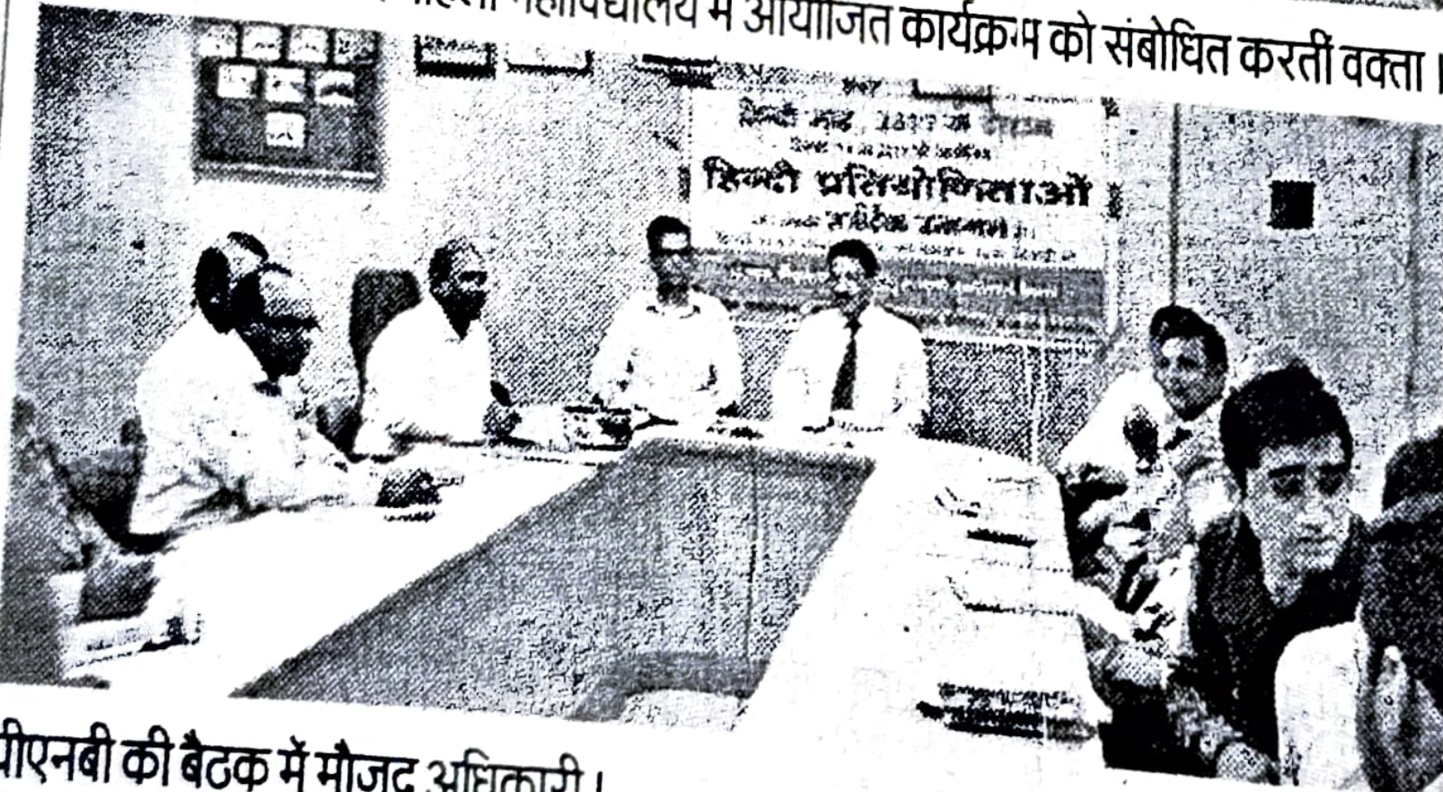
पीएनबी की बैठक में मौजूद अधिकारी ।