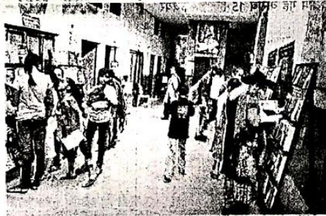
पुस्तक मेले का अवलोकन करते बच्चे व विद्यार्थी

को सम्मानित किया। मुख्य अतिथि ने छात्राओं द्वारा लगाई गई लगभग 35 स्टॉल का निरीक्षण किया। इन स्टॉल में छात्राओं ने ज्वेलरी, कपड़े, फूट घाट, दीये, हरियाणवी, पंजाबी, राजस्थानी, गुजराती खानों का प्रबंध किया था। सभी प्राध्यापिकाओं व छात्राओं ने इन सभी का खूब आनंद उठाया। मुख्यातिथि ने कहा कि छात्राओं ने इतने बड़े स्तर पर वास्तव में बहुत अधिक मेहनत की है। इस स्टॉल में पूरे प्रांत की झलक दिखाई दे रही थी। इसके अतिरिक्त मेले में तीन प्रतियोगिताओं रंगोली, फैंसी ड्रेस, बेस्ट स्टॉल का आयोजन किया गया।