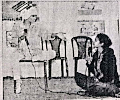
मतदाता जागरूकता को लेकर नाटक का मंचन करती छात्राएं।

कार्यक्रम में कॉलेज की राजनीति विभाग की छात्राओं द्वारा मतदान जागरूकता हेतु नाटक मंचन... चुनावों का सफर प्रस्तुत किया गया, जिसमें अलग-अलग क्षेत्रों के मतदाताओं एवं प्रतिनिधियों के विचारों को दर्शाया गया। दर्शाने का प्रयास किया गया कि किस तरह नेता वोट मांगते हैं और कैसे जनता सही प्रतिनिधि का चुनाव करती है। इसके बाद अध्यक्ष ने छात्राओं से कहा कि सन 2011 में मतदाता दिवस को मनाने की शुरुआत की गई थी। तभी से ही स्वीप का भी आयोजन किया जाने लगा। उन्होंने बताया कि कुरुक्षेत्र जिले में 66 हजार के लगभग मतदाता हैं, जिनका पंजीकरण