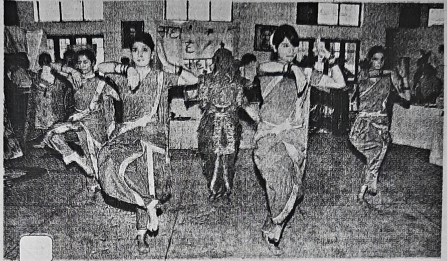
डीएन कॉलेज में सांस्कृतिक कार्यक्रम में प्रस्तुति देती छात्राएं।