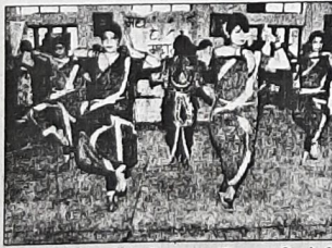
डी.एन. कॉलेज में नृत्य की प्रस्तुति देती छात्राएं।

कुरुक्षेत्र, 29 सितम्बर (वालिया)। दयानंद महिला महाविद्यालय कुरुक्षेत्र में विश्व पर्यटन दिवस के उपलक्ष्य में टूरिज्म सोसायटी की तरफ से सांस्कृतिक प्रदर्शनी व समारोह का आयोजन किया गया। इसमें महाविद्यालय की 50 छात्राओं ने भाग लिया। छात्राओं ने महाराष्ट्र और जम्मू-कश्मीर की संस्कृति