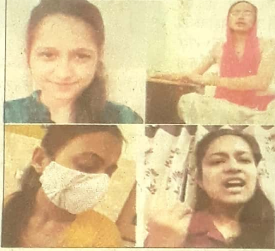
ऑनलाइन प्रतियोगिता की विजेता छात्राएं।