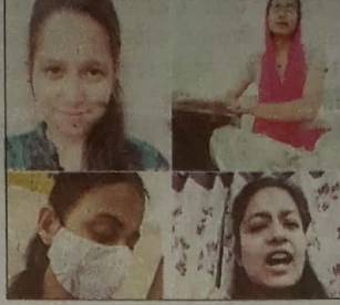
प्रतियोगिता में हिस्सा लेती छात्राएं।