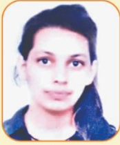
कु० महक बी० कॉम द्वितीय सेमेस्टर में चौदहवाँ स्थान