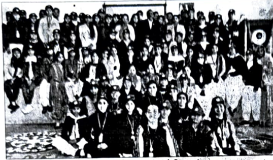
कार्यक्रम में भाग लेते अतिथि व स्वयंसेविकाएं।