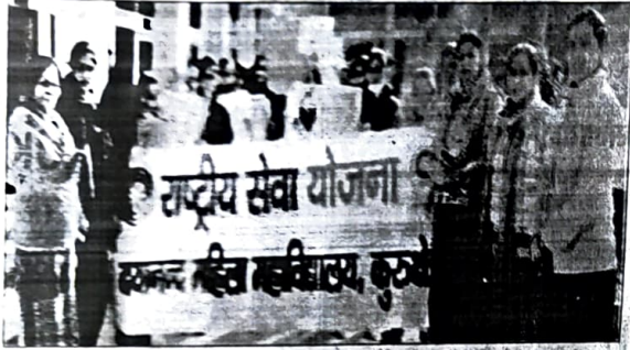
रैली निकालती स्वयं सेविकाएं।