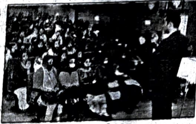
विद्यार्थियों को जानकारी देने वक्त।