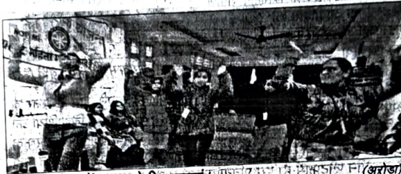
योग शिविर में भाग लेती छात्राएं।