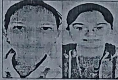
कार्यक्रम की विजेता छात्राएं।