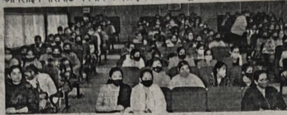
पासपोर्ट कार्यशाला में उपस्थित छात्राएं।