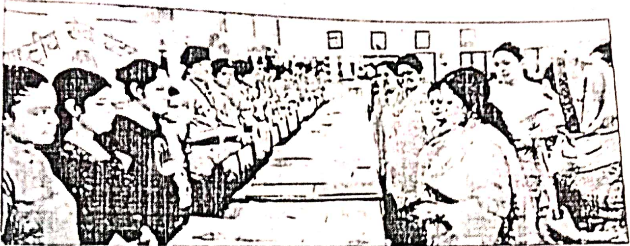
छात्राओं की ओर से लगाई गई प्रदर्शनी को देखती शिक्षिकाएं।