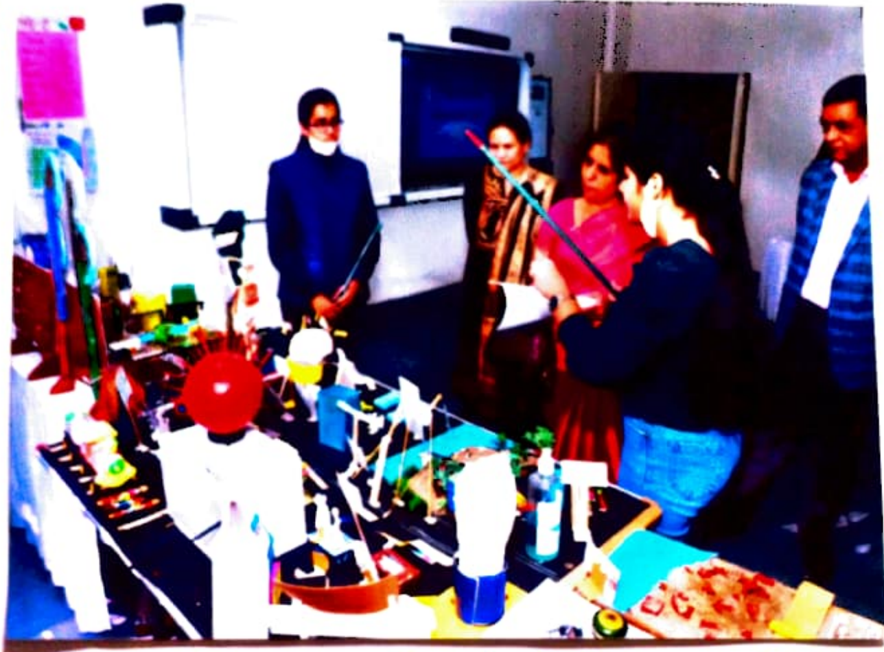
2nd Position in Distt Level Science exhibition