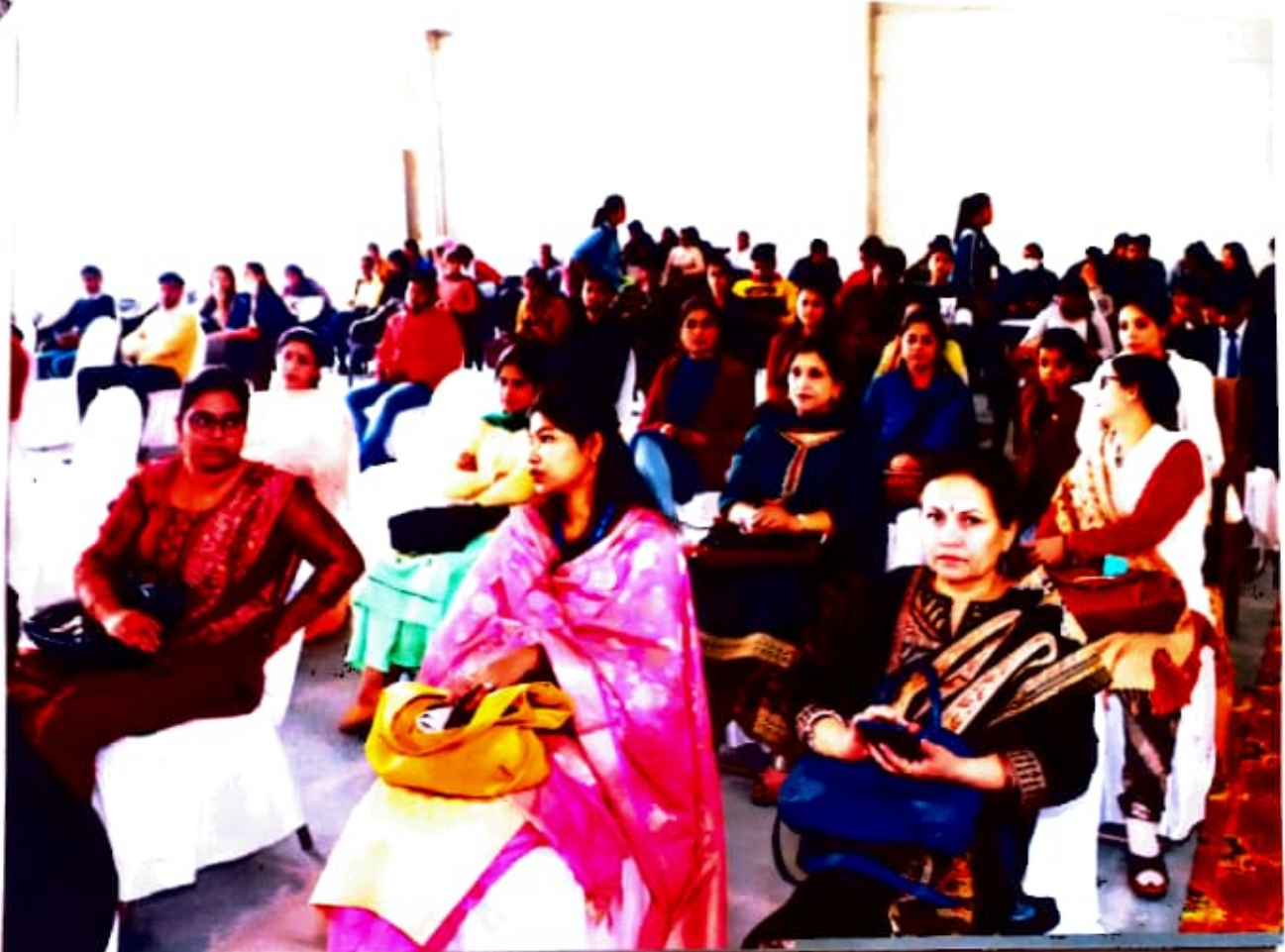
Prize Distribution Ceremony of Science Exhibition. Govt College Palwal. KKR