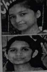
प्रतियोगिता की विजेता छात्राएं।